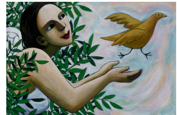
Illustration: Anita Klein. www.anitaklein.com „Angel launching a bird“